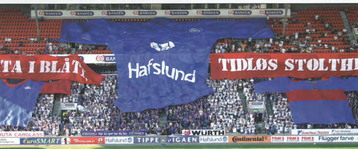
VIF - Fredrikstad 2004