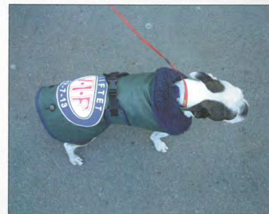
Toy S reisekåt