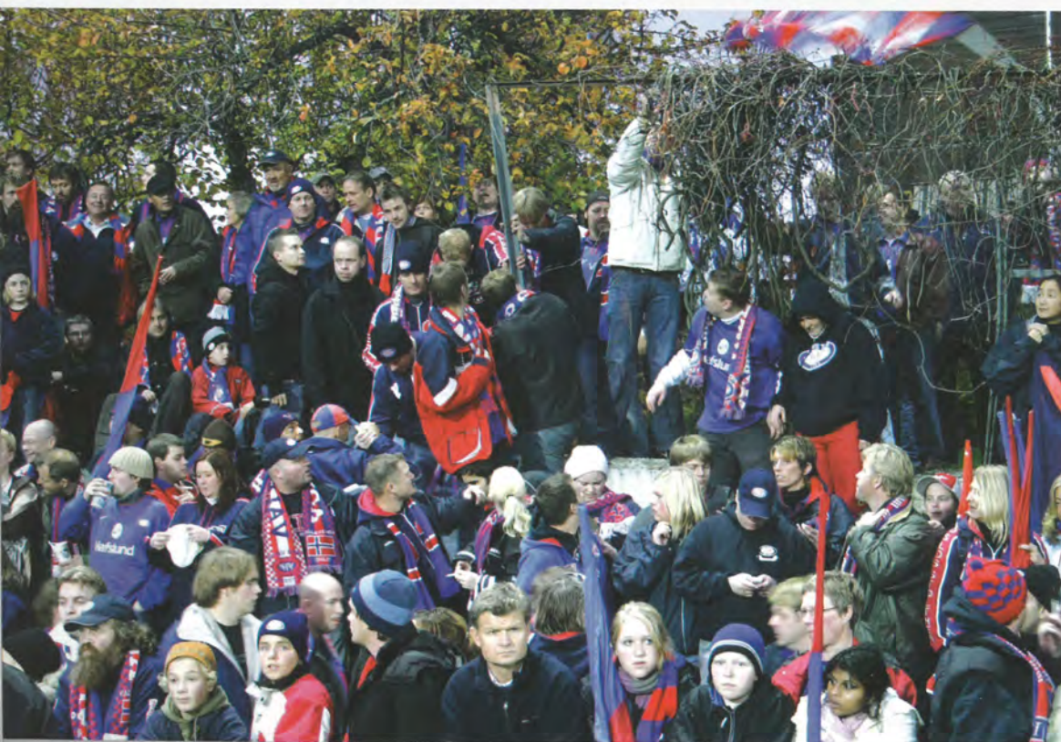
Med fasiliteter slik de vi ble møtt med på Hamar i friskt minne vil det bli mye folkus på billkvoter og plassering i 2005.

Åpningstider i Sjappa i des: Mand. - fre. 10.00 - 18.00. Lør. 10.00-16.00. 27.-30. des 10.00 - 20.00