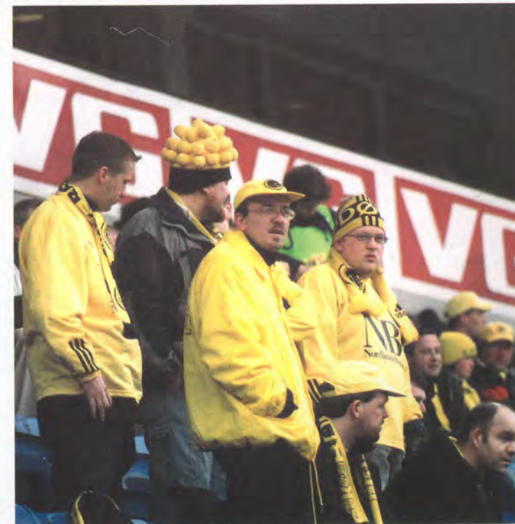
Den Gule Skare, et fargerikt innslag i norsk fotball.