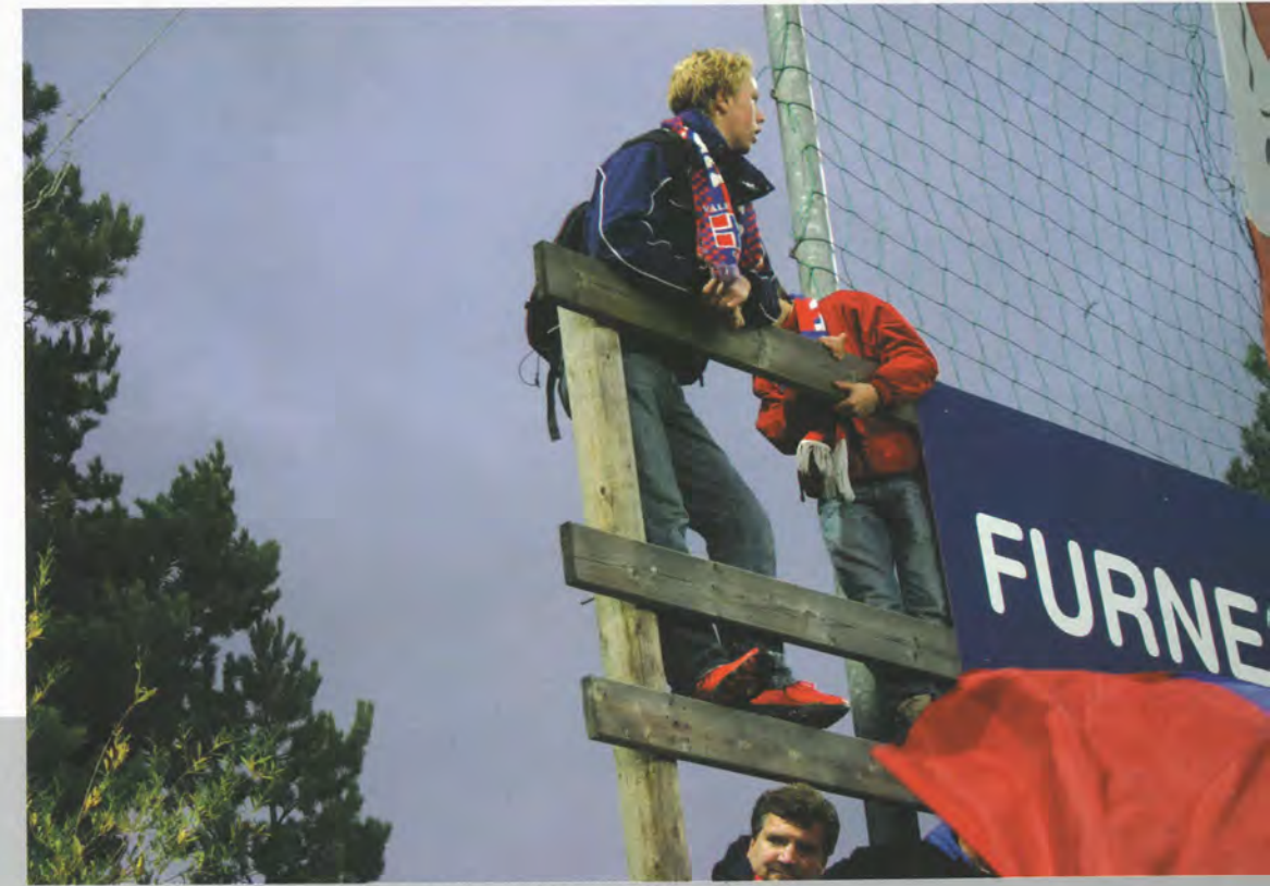
Greit at man har kjøpt ståplass men det bør værre grenser for hva man må gjøre for å få et glimt av banen.