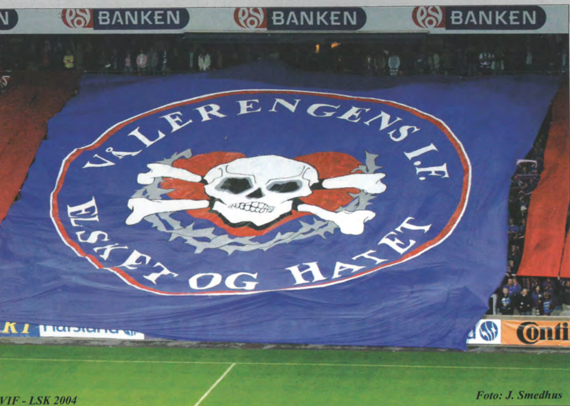
VIF - LSK 2004