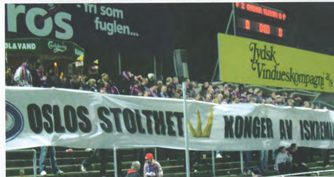
Engangsbanner i Esbjerg laget av EngaTifo "VIF - Oslos stolthet - Konger av Iskremligaen"

Klubben tok sin første tittel allerede i 1912, og er svenske mestere totalt 10 ganger (bl.a. i 2002 og 2003). i år ramlet de 3 plasser ned, og møter oss i Royal League i egenskap av dette. i tillegg vant de den for de fleste totalt ukjente svenske cupen, hvilket kvalifis-