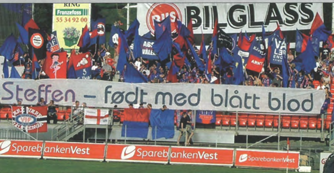
Brann - VIF 2004

Vi hadde med en bunt med flagg, samt et engangsbanner som viste Steffen Iversen at vi var takknemlig fordi han hadde kommet til oss ("Steffen – født med blått blod"). Mange hundre mennesker og så mye fargelegging er imponerende på en mandag 60 mil borte.